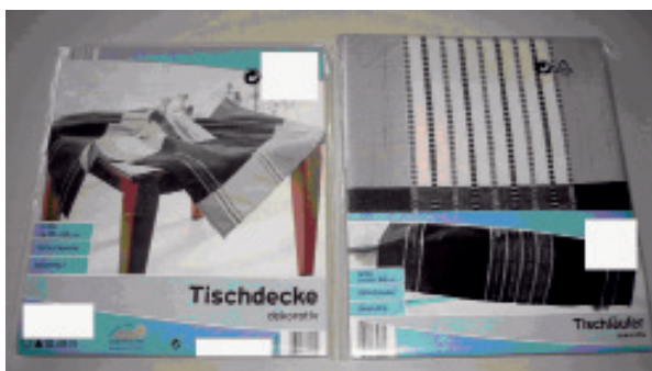
Εικ. 2. Το αντίγραφο που κατασχέθηκε από την επιχείρηση που διέθετε τα προϊόντα σε μειωμένες τιμές