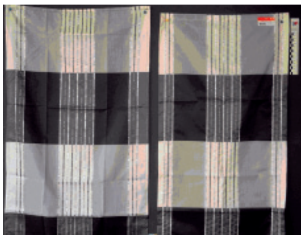
Εικ. 3. Αντίγραφο Αυθεντικό

Photos: Alfred Apelt GmbH, Courtesy of "Verband der Deutschen Heimtextilien-Industrie e.V.", 2009.