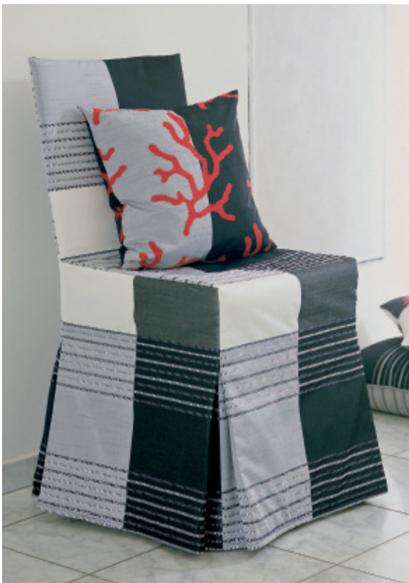
Εικ. 1. Σχέδιο του Alfred Apelt GmbH (www.apeltstoffe.de)