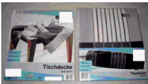
Εικ. 2. Το αντίγραφο που κατασχέθηκε από την επιχείρηση που διέθετε τα προϊόντα σε μειωμένες τιμές