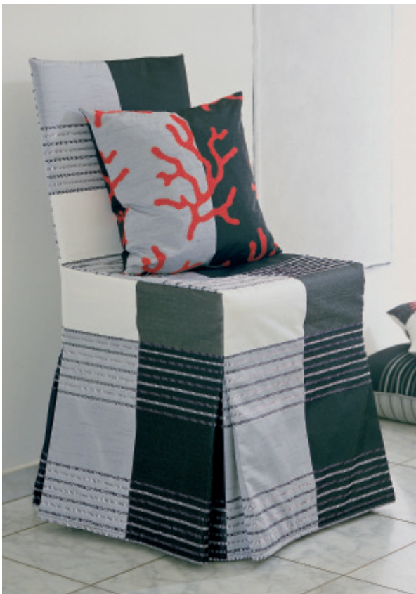
Εικ. 1. Σχέδιο του Alfred Apelt GmbH (www.apeltstoffe.de)