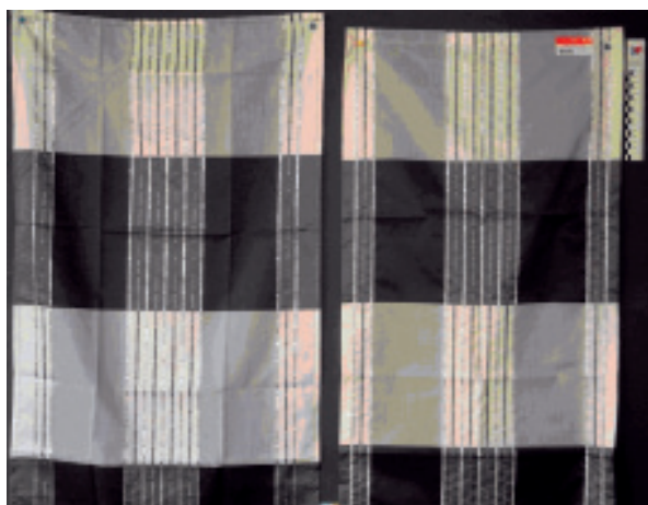
Εικ. 3. Αντίγραφο Αυθεντικό